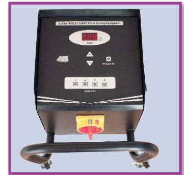
Bedien- und Steuereinheit [ operation panel ]