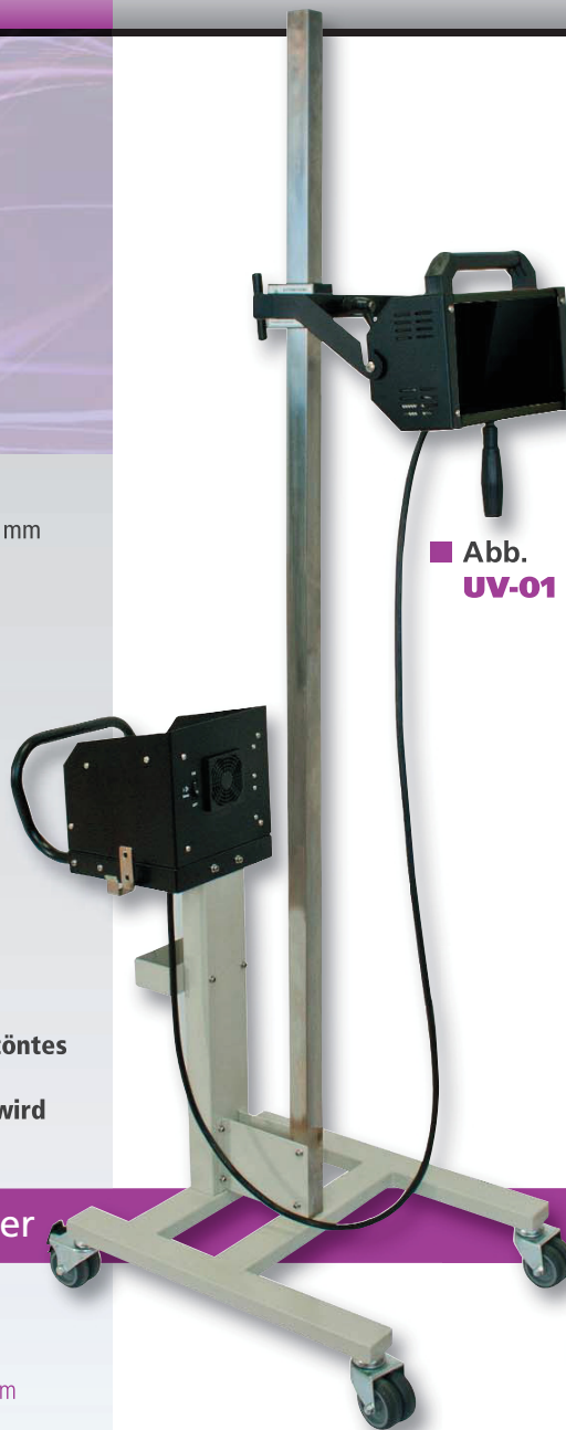
■ Abb. UV-01

Best possible B-TEC-Safety: Dryer has an effective and tinted UV-B/-C-filterglass. Harmful UV radiation and blinding is eliminated.