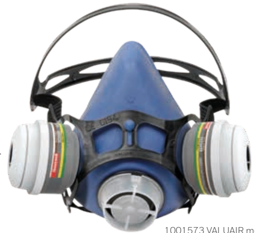
1001573 VALUAIR met 1035459 patronen

De filters uit de N-serie zijn 20% lichter en 12% korter in diameter dan de T-serie en bieden meer comfort voor de drager. Bovendien bieden ze optimale bescherming tegen vele gevaarlijke gassen en dampen, waaronder gebruik in explosieve werkomgevingen.