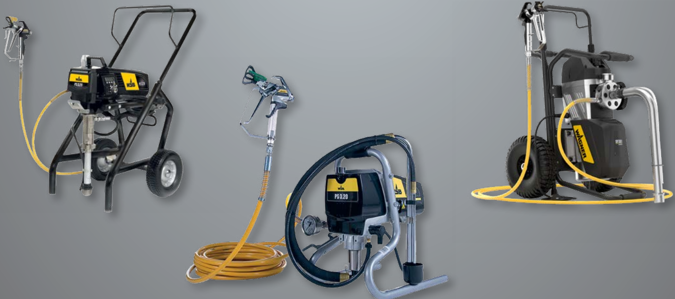
ProSpray 3.20 op frame met hogedrukslang 27 MPa; Ø 6mm; 1/4"; 15 en HEA ProTip 517.