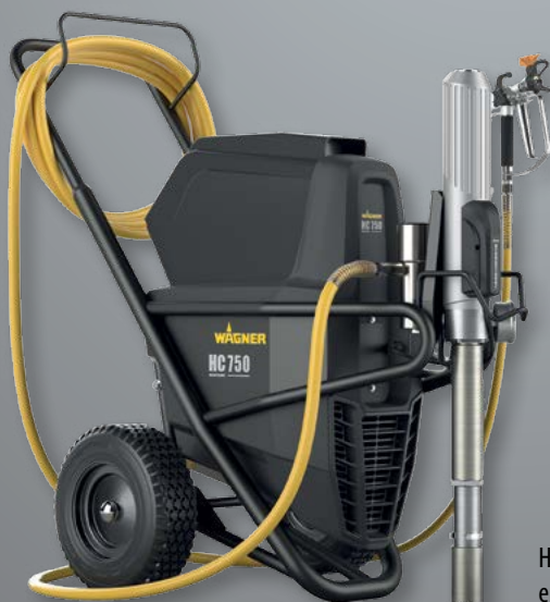
HeavyCoat 750 met aanzuigfilter, AG19 pistool en 2,5 m DN10 mm slang